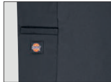
Bolsillo adicional en la pierna