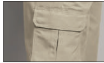
Bolsillos cargo plisados, con compartimientos ocultos