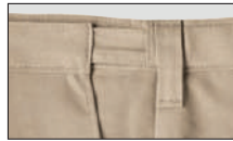
Cómodo detalle en la cintura