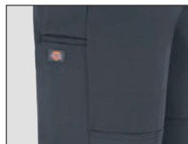
Bolsillo adicional en la pierna