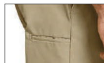
Bolsillo lateral multiusos