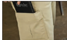
Bolsillo cargo con pliegues