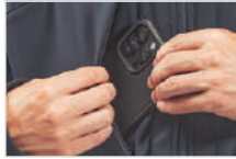
Bolsillo para teléfono celular