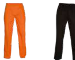
Pantalón Chef (PCH)